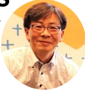
消費者庁 消費者教育推進課 課長補佐

「SDGs」には消費生活に関わる「つくる責任 つかう責任」という目標が掲げられています。持続可能な社会の実現に向けた様々な取組をご紹介します。