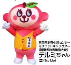
青森県消費生活センターマスコットキャラクター(消費者教育推進大使) テルミちゃん (Tel. Me)